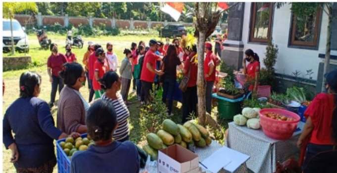
Sumber: Desa Taro, 2022

dalam pasar murah Desa Taro (Gambar 4. di bawah). Selain Pasar Murah Desa Taro juga memberikan Pelayanan Makanan Tambahan (PMT) bagi Balita dan anak-anak dari hasil kebun organik dan kebun RTM Desa Taro