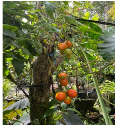
Gambar 2. Sampah organik di rumah Perbekel Desa Taro dan kebun organik menggunakan kompos yang diolah sendiri

3) Praktik pengolahan sampah anorganik menjadi kerajinan tangan Karang taruna Sarwa Dharma Bakti, PKK Desa Taro dan para pengrajin yang ada di Desa Taro diberikan pelatihan praktik membuat kerajinan tangan dari sampah anorganik. Bentuk kerajinan yang dipraktikkan diantaranya berupa tas anyaman dari plastik. Di TPS 3 R Desa Taro juga terdapat satu mesin prolisis yang berguna untuk melebur plastik kemudian plastik cair dicetak berbagai bentuk pernak-pemik diantaranya berbentuk gajah dan lembu sesuai icon Desa Taro untuk dijadikan cendera mata.