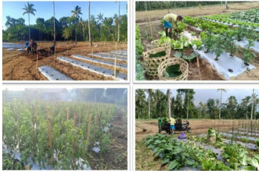
Gambar 3. Kebun Organik Desa Taro

Kebun organik di Desa Taro dibuat untuk menciptakan ketahanan pangan Desa Taro serta dapat menjadi edukasi bagi anak-anak sekolah di Desa Taro agar anak-anak dapat mengenal tanaman sejak dini. Hasil dari kebun organik yang dikelola oleh Bumdes Desa Taro, dijual dalam pasar murah Desa Taro (Gambar 4. di bawah). Selain Pasar Murah Desa Taro juga