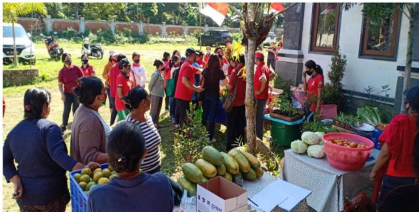
G Gambar 4. Pasar Murah Desa Taro

memberikan Pelayanan Makanan Tambahan (PMT) bagi Balita dan anak-anak dari hasil kebun organik dan kebun RTM Desa Taro